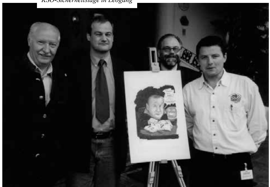
KSÖ-Sicherheitstage in Leogang