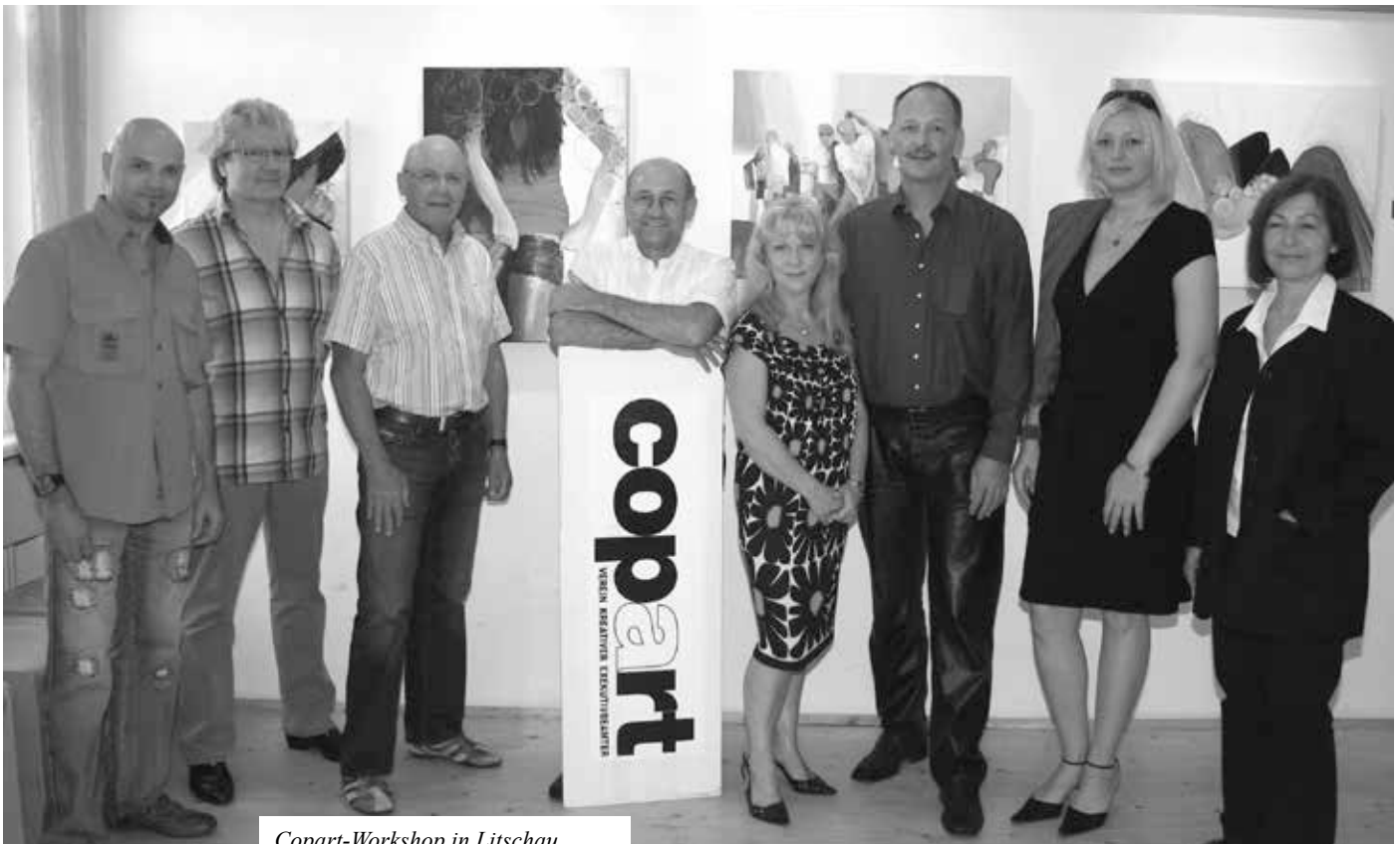
Copart-Workshop in Litschau