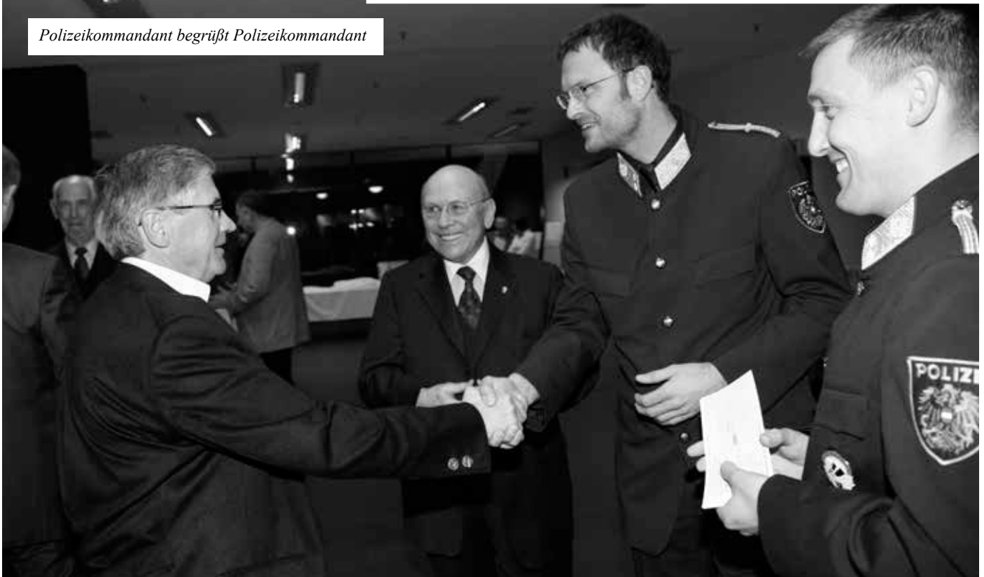
Polizeikommandant begrüßt Polizeikommandant