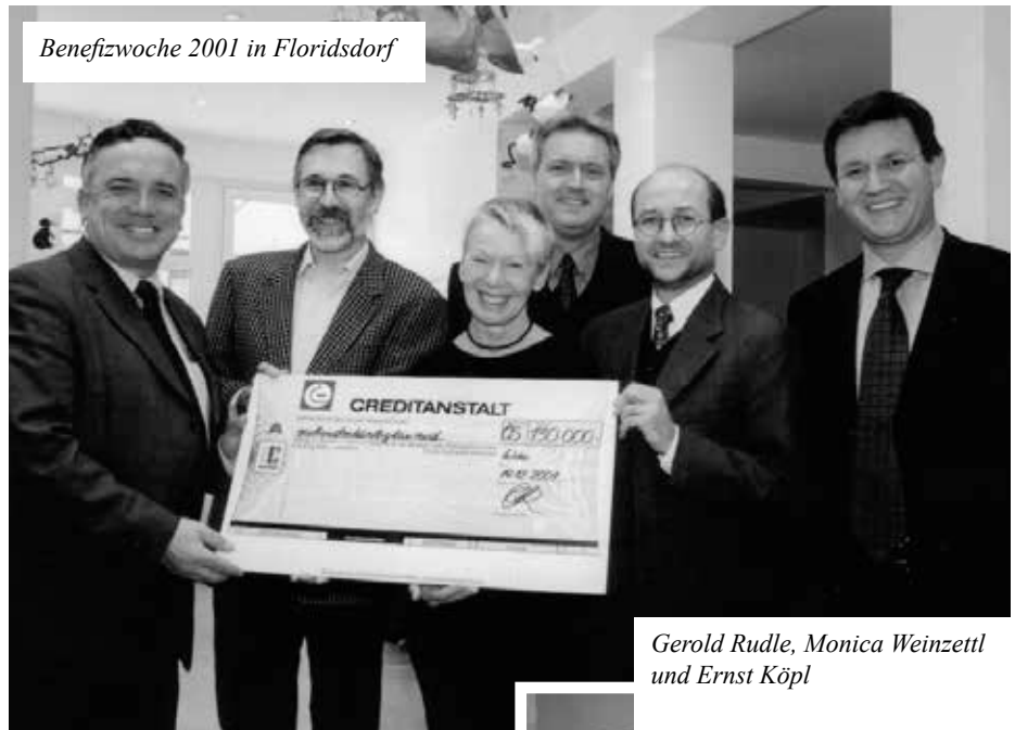
Benefizwoche 2001 in Floridsdorf